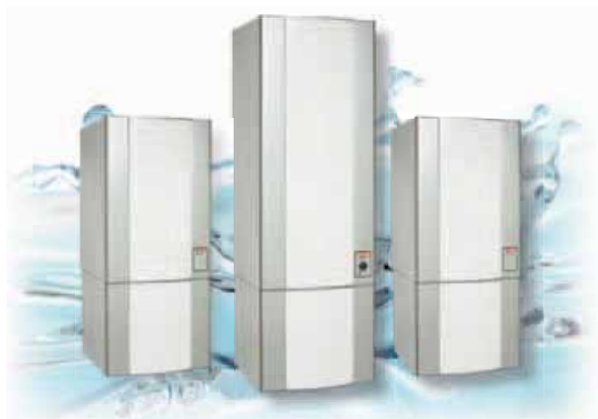
METRO MODUL RST 200 ja 300 litraa