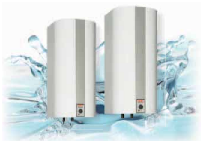
METRO ZENIT RST 60 ja 110 litraa

Rst-varaajien säiliö on ruostumatonta erikoisterästä. Emali-varaajien säiliö on emaloitua terästä ja vastus suojaaputkessa. Suoja-anodin ansiosta emaloitua varaajat soveltuvat erityisesti kalkkisiin sekä suolaisiin vesiin.